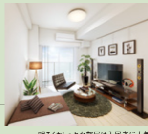
明るくおしゃれな部屋は入居者に人気 (VERXEED 浦安)

なったときは、ローンが完済された収益不動産を家族に残すことができます。一般の生命保険と比べた場合、不動産投資は実物資産を持つという安心感や、売却できるなどの特色があります。保険金は万一の際に支払われますが、保有物件の賃料収入は自分が元金うちにも受け取れます。私たちは価値ある不動産事業を通じて、お客様とその家族が安心して資産形成のお手伝いをさせていただきます」(梶尾氏)